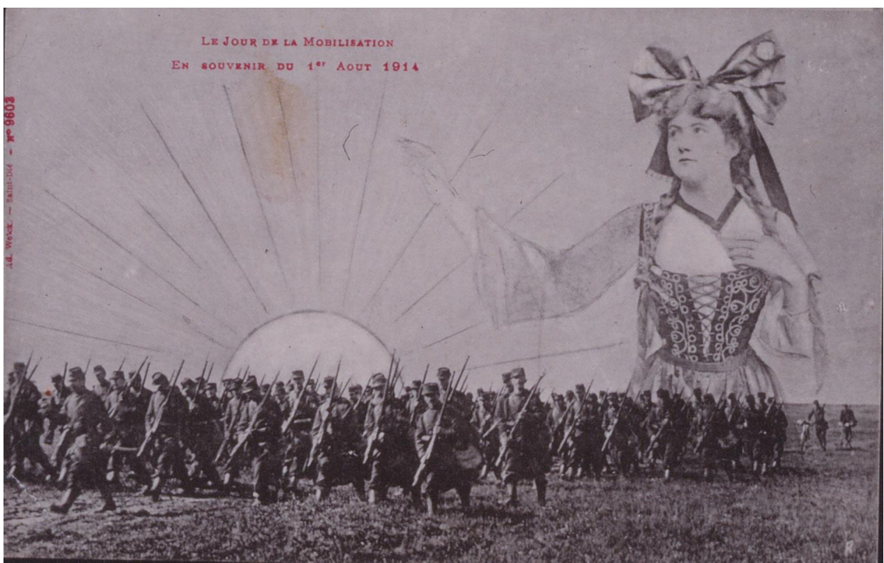
Carte postale fantaisie de l'éditeur déodatien Adolphe Weick

L'historien reviendra sur le contexte local, le déroulement et les conditions de départ des Vosgiens pour les guerres en 1914 et 1939.