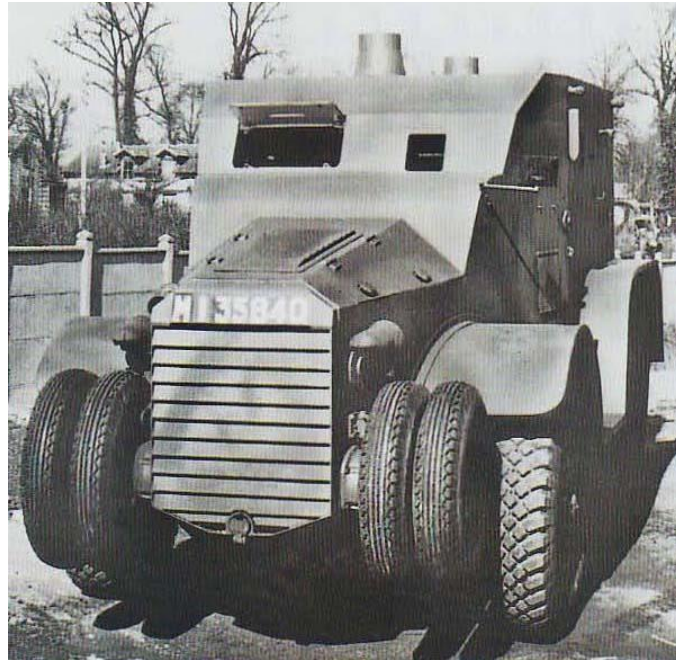
Véhicule de commandement Lorraine 28 du 5 e Bataillon de Chasseurs Portés en 1939

Axel Balland animera une conférence intitulée « le 5 e Bataillon de Chasseurs Portés de 1937 à 1940 » qui aura lieu le vendredi 26 juillet à 20 h à la Maison des associations à Bruyères.