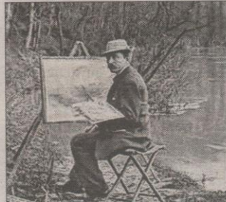
Alfred Renaudin a laissé une œuvre importante et des toiles vantant les plus beaux villages et paysages de Lorraine.

Les visiteurs vont pouvoir découvrir ou redécouvrir une partie de l'œuvre de ce peintre qui savait poser son chevalet dans les endroits les plus pittoresques. « Pour cette occasion exceptionnelle, deux propriétaires privés lorrain et parisien ont accepté de prêter une partie de leur collection pour le plus grand plaisir des visiteurs. L'entrée libre au musée débouche sur un parcours composé de 82 toiles, de formats différents, reprenant les thématiques chères à celui qui "voulait qu'on se promène dans ses toiles"