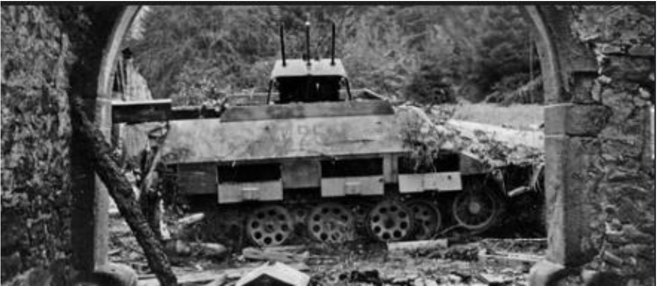
Véhicule blindé allemand Sdkfz 251 détruit lors des combats de Saint-Michel-sur-Meurthe en novembre 1944

Les mythes et légendes de la Seconde Guerre mondiale dans les Vosges