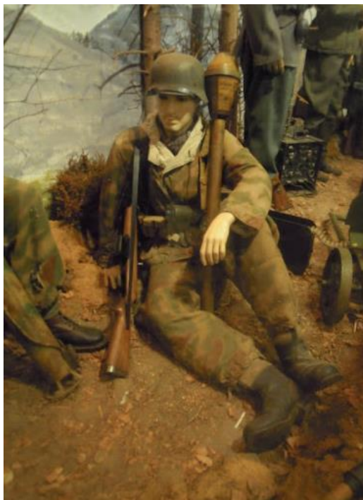
Combattant de la 708. Volksgrenadier Division en 1944 (musée de Turkheim)