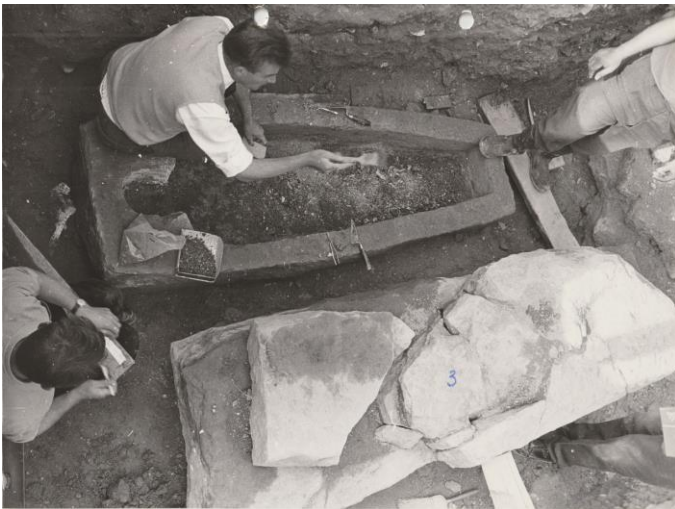
Les sarcophages de la cathédrale

La Société Philomatique vosgienne propose dans le cadre des Journées du patrimoine trois interventions sur site le samedi 19 septembre 2020 :