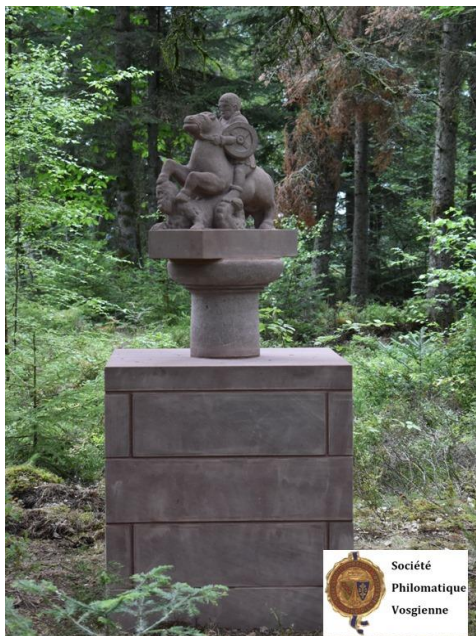
Cavalier à l'anguipède