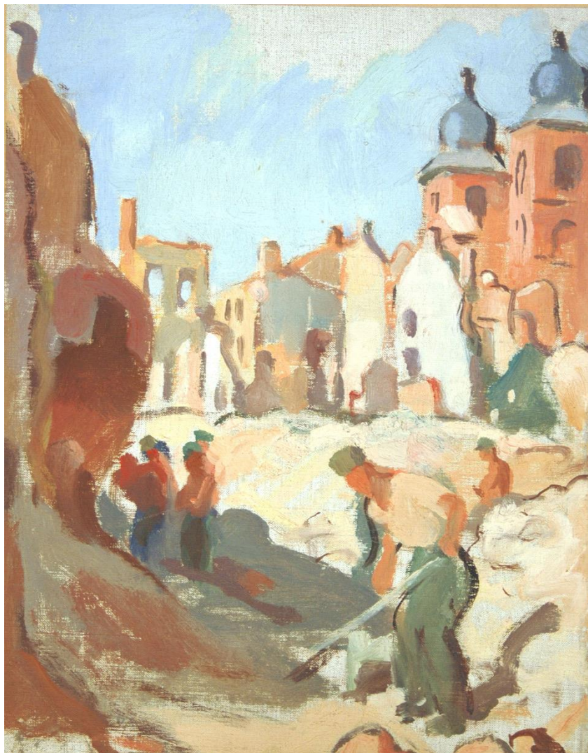
Prisonniers allemands déblayant les ruines de Saint-Dié 1945 Tableau de Maurice Ehlinger - Collections du musée de Saint-Dié

Quelles ont été leurs conditions de travail, d'hébergement et leurs relations avec une population traumatisée ?