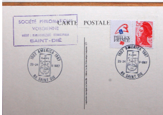
SAINT-DIE-DES-VOSGES. MARRAINE DE L'AMÉRIQUE 1507

La Terre des canibales (Venezuela actuel).