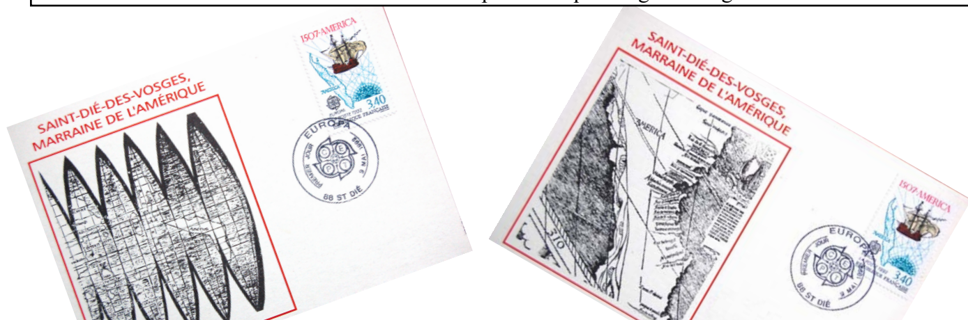
SAINT-DIE-DES-VOSGES. MARRAINE DE L'AMÉRIQUE 1507.1987

Site Internet : www.philomatique-vosgienne.org