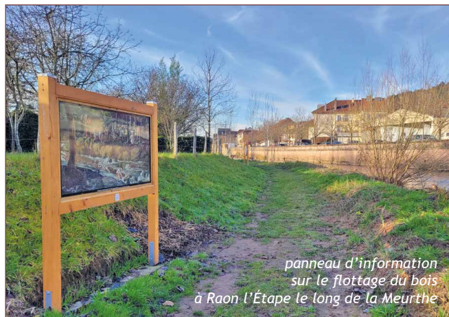
panneau d'information sur le flottage du bois à Raon l'Étape le long de la Meurthe

27 septembre 2025 : inauguration de la «Promenade Roland Zaninetti» à Raon l'Étape (pupitre et support de panneau réalisés par «Les Amis de la Hallière»)