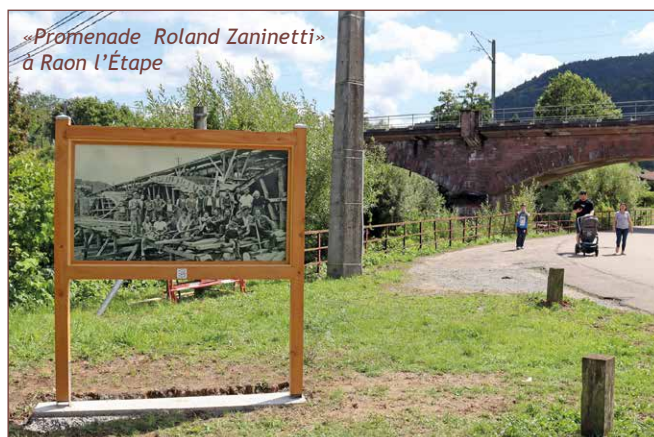
«Promenade Roland Zaninetti» à Raon l'Étape

Nos tables sont de plus en plus appréciées. Vendues à des particuliers, elles occupent aussi les abords et les plages des lacs de Pierre-Percée, les espaces verts des communes de «la Vallée» ainsi que ceux de l'ancien hôpital de Raon l'Étape.