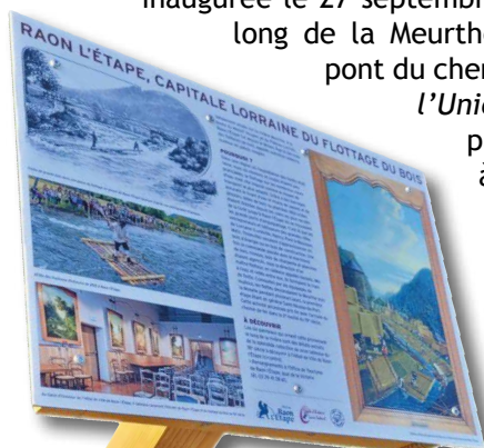
pupitre sur le flottage du bois

Sept ossatures de panneaux et deux pupitres ont été conçus et fabriqués par les bénévoles de l'association pour la Ville de Raon l'Étape. Ces panneaux agrémentent la «promenade Roland Zaninetti» inaugurée le 27 septembre 2025. Elle serpente le long de la Meurthe, rive gauche entre le pont du chemin de fer et le «pont de l'Union - 1 er janvier 1947». Un panneau rend hommage à notre célèbre accordéoniste local. Les autres nous font revivre le flottage à travers les reproductions (détails) des tableaux du Salon d'Honneur de l'Hôtel de Ville de Raon l'Étape.