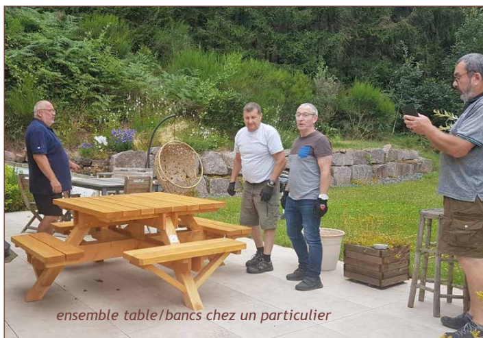
ensemble table/bancs chez un particulier