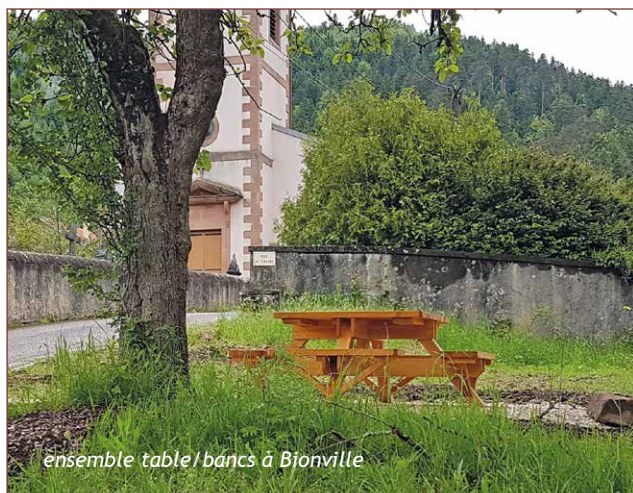
ensemble table/bancs à Bionville

Nos tables sont de plus en plus appréciées. Vendues à des particuliers, elles occupent aussi les abords et les plages des lacs de Pierre-Percée, les espaces verts des communes de «la Vallée» ainsi que ceux de l'ancien hôpital de Raon l'Étape.