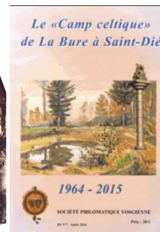
Tirés à part

Découvrez 143 années d'histoire de l'archéologie lorraine et vosgienne au sein de nos bulletins anciens, de notre revue semestrielle et de nos multiples productions